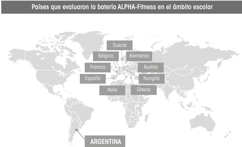
Figura 3.5. Países que aplicaron la batería ALPHA-Fitness en el ámbito escolar y publicaron los resultados de sus estudios.

estudio publicado con estas características en población pediátrica argentina. 58