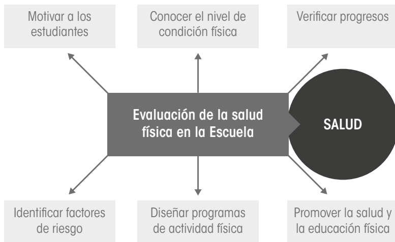
Figura 3.4. Objetivos de un programa de evaluación de la condición física relacionada con la salud en el ámbito escolar.

largo de toda la vida para mantenerse mental, metabólica, física y funcionalmente saludables. 25