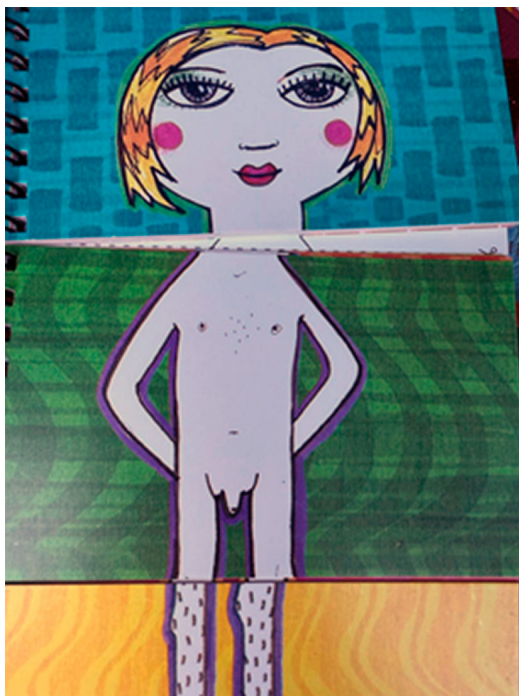
Figura 3. Masculinidad y feminidad como constructos sociales

de partes o características intercambiables a voluntad. 31 En consecuencia, la Educación Sexual Integral se encargará de divulgar una nueva visión antropológica, normalizar autopercepciones “esquizo-culturales” y discriminar la percepción inmediata del cuerpo sexuado.