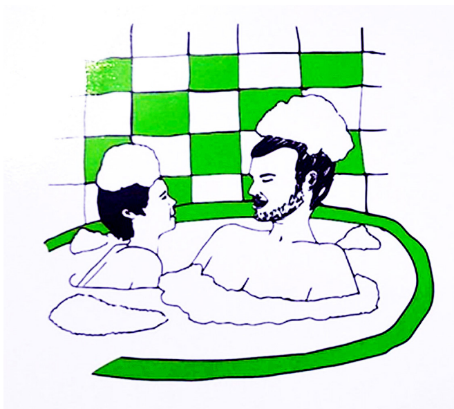
Figura 2. Tarjeta de juego sobre la reivindicación de la pedofilia, 2