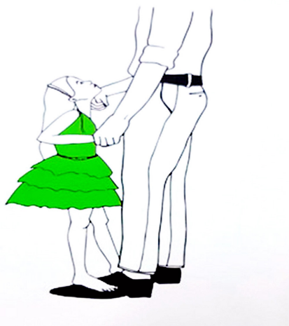
Figura 1. Tarjeta de juego sobre la reivindicación de la pedofilia, 1

Según Preciado, la maquinaria social penaliza al pedófilo para expiar los propios impulsos perversos, que una sociedad auténtica y democrática legalizaría. Otro apologeta de la pedofilia es Leonardo Alfonso Arce Vidal, quien dedicó su tesis a los Pedófilos e infantes: pliegues y repliegues del deseo . Allí sostiene que el pedófilo es juzgado como un criminal por la imposibilidad cultural de pensar al infante como un ser sexuado. Su tesis propone un “giro pedófilo” 16 que erotice a los niños y termine con la estigmatización, la patologización y la “violencia desexualizadora que proscribire al infante de los círculos de lo erótico, de lo sensual y de lo sexual”. 17 Las figuras 1 y 2 de este artículo ilustran dicha reivindicación.