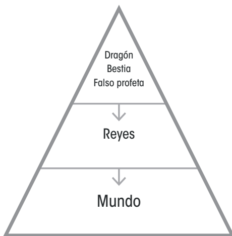
Figura 1. Pirámide de poder según Apocalipsis 16

Las figuras 1 y 2 ilustran las pirámides de poder de Apocalipsis 16 y 17.